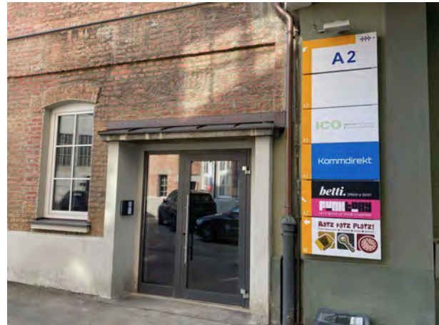
Zugang über Treppenhaus