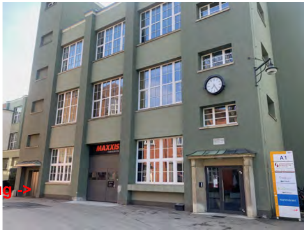
Zugang über Aufzug Gebäude A1 (Aufzug links neben Maxxis)